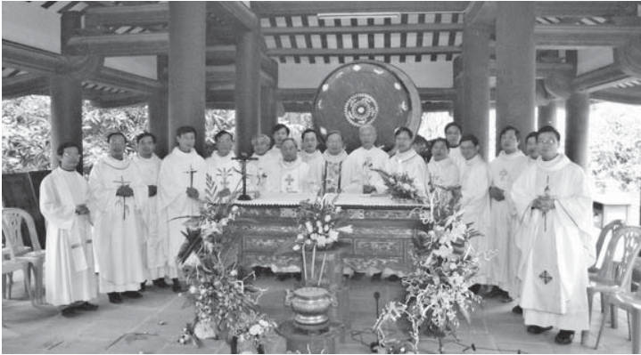
Đức Giám Mục Hải Phòng dâng lễ tại nhà khách dòng họ Vũ Võ ở Mộ Trạch.